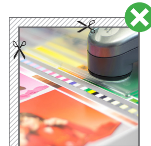
■ Fig. 1: Hintergründe bitte immer vollflächig anlegen. // Fig. 1: Please use backgrounds full surface.